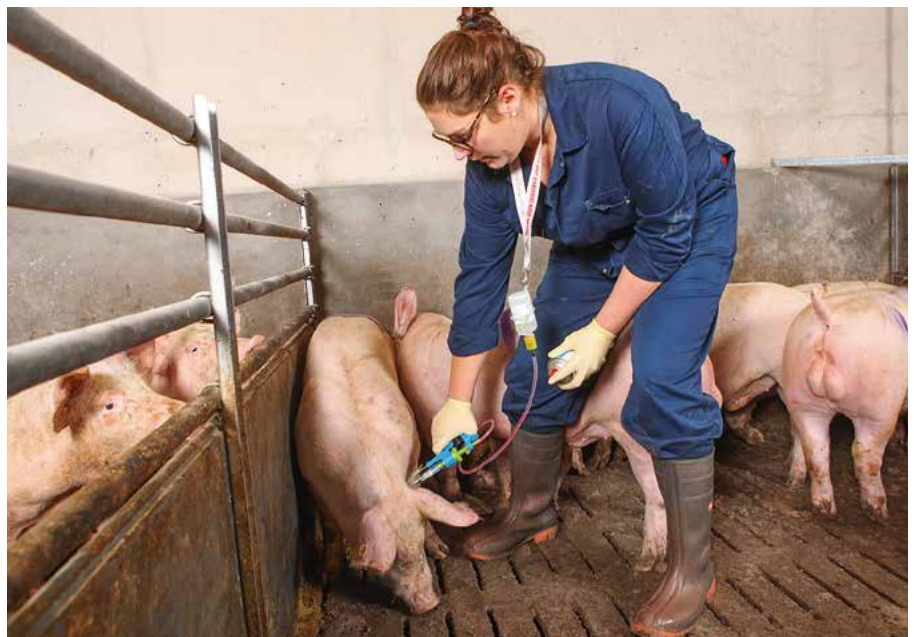
Wie bei der Jungebermast wird eine getrenntgeschlechtliche Aufstallung der Impfeber empfohlen. In Kleingruppen kann eine Person alleine impfen.

Mit der zweiten Impfung, die eine deutlich stärkere Antikörperbildung auslöst als die erste, verändert sich das