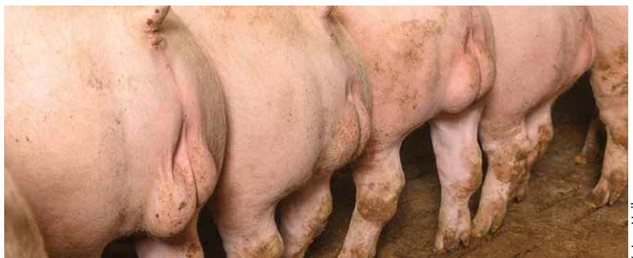
Hat die zweite Impfung angeschlagen, werden die Tiere nicht nur ruhiger. Die bis dato normal entwickelten Hoden bilden sich auch sichtbar zurück.